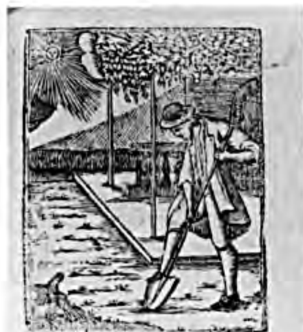
Da vecchio Padre generato incomodo, Faccia da giovin Molte ante incomodo; Comodo crebbi, sempre co nar comodi, Ed ho giurato di morir incomodo.